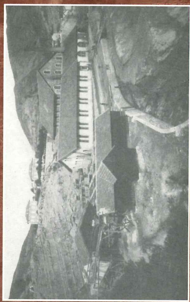
La grande laverie des mines de Flaviac vers 1907

C'est aussi de cette époque que datent les bâtiments du directeur et des ingénieurs, situés au-dessus de la grande laverie. L'apogée de la mine se situe en 1906 avec 235 mineurs et une production de plus de 4 000 tonnes.